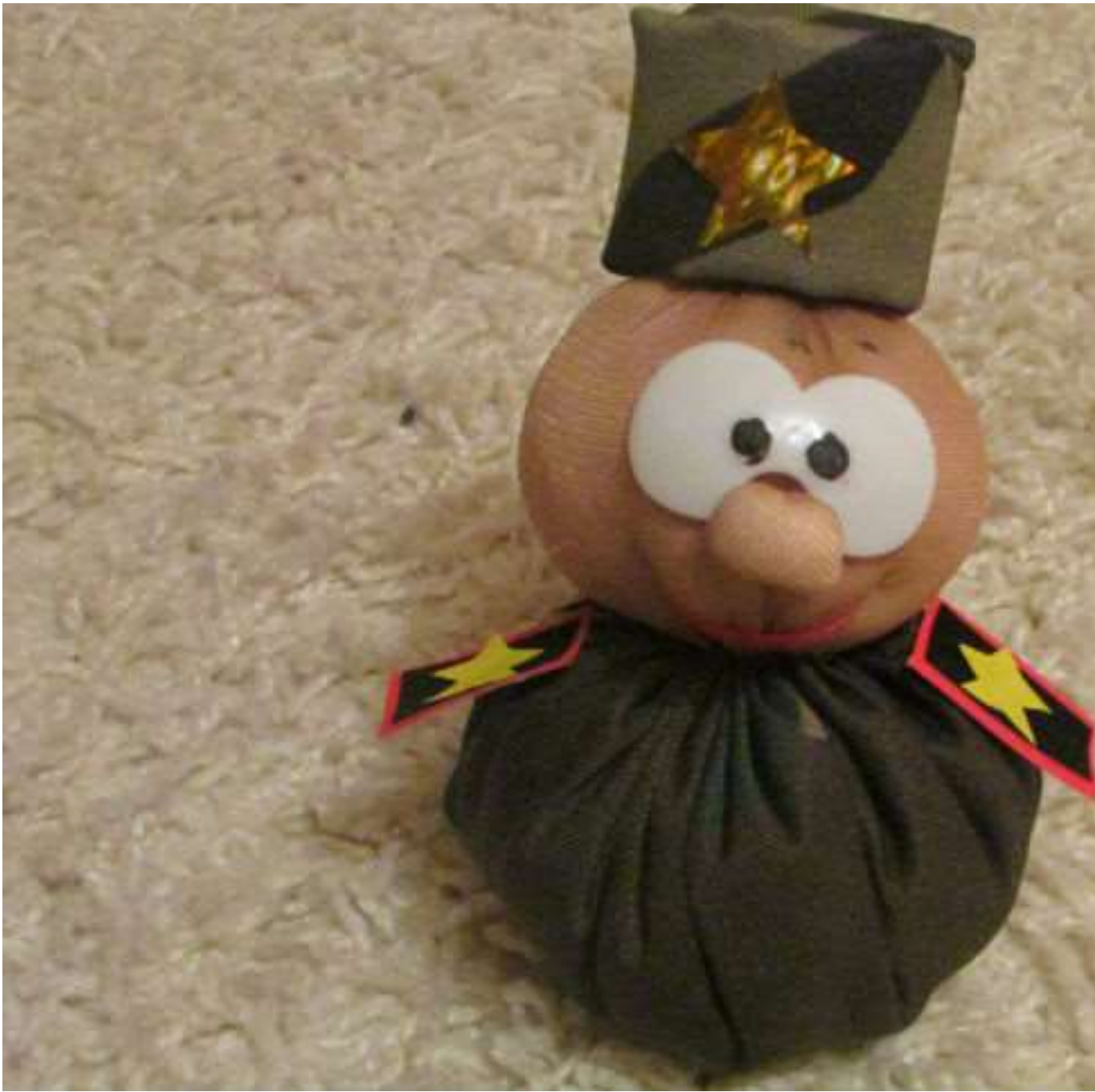
Получился красивый пuzатенький солдатик своими руками.